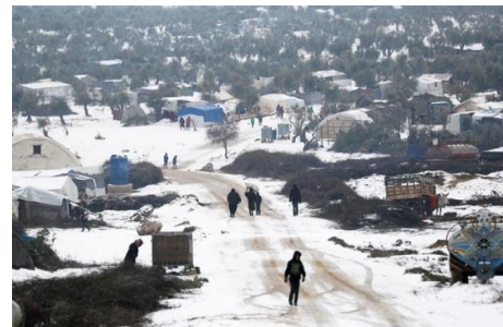
Campo profughi a Idlib

Giovedì 19 marzo 2020, ore 21:00 in Sala Blu Ingresso da via Osoppo 2