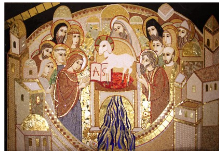
Marko Rupnik, La Gerusalemme Celeste