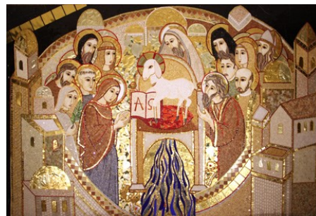
Marko Rupnik, La Gerusalemme Celeste

"La vacanza è il tempo più nobile dell'anno, perché è il momento in cui uno si impegna come vuole col valore che riconosce prevalente nella sua vita". (L. Giussani)